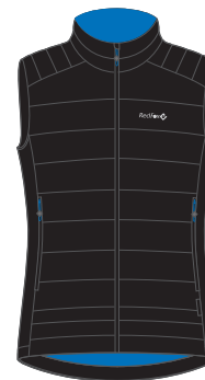
1000 черный black

ЖИЛЕТ УТЕПЛЕННЫЙ ЖЕНСКИЙ/INSULATED VEST WOMEN'S