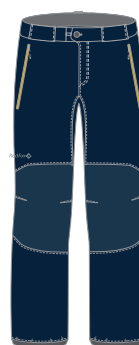
9900 черно-синий black-blue