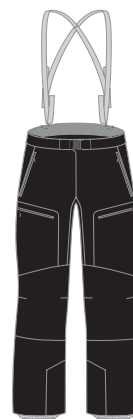
1000 черный black