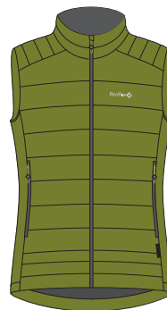
5800 оливковый olive