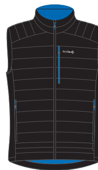
1000 черный black

ЖИЛЕТ УТЕПЛЕННЫЙ МУЖСКОЙ/INSULATED VEST MEN'S