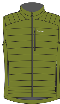
5800 оливковый olive