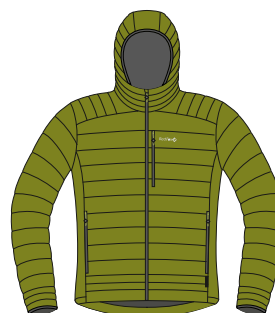
5800 оливковый olive