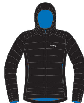
1000 черный black

КУРТКА УТЕПЛЕННАЯ ЖЕНСКАЯ/INSULATED JACKET WOMEN'S