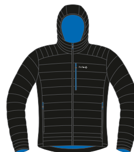
1000 черный black

КУРТКА УТЕПЛЕННАЯ МУЖСКАЯ/INSULATED JACKET MEN'S