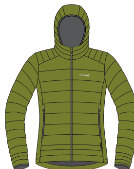
5800 оливковый olive